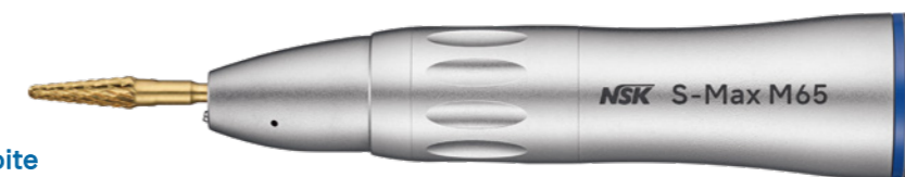
Pièce à main Droite